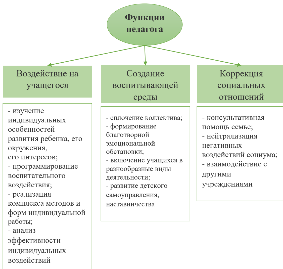
Схема 1. Воспитательные функции педагога дополнительного образования

Воспитательная деятельность педагога дополнительного образования заключается в одновременной разноплановой работе по формированию личности каждого отдельного учащегося, детского творческого коллектива и родительской общности (см. Таблицы 2, 3).